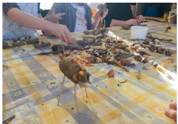
Des ateliers dans les écoles, de janvier à mars

la Communauté de communes de Bièvre Est. Attention : certaines médiathèques seront fermées au mois d'août !