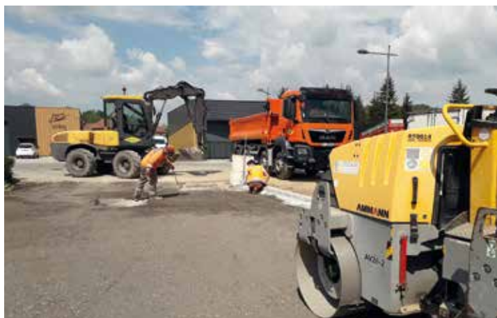
Aménagement d'une voirie sur la ZA de Rossatière par la société Colas

Bièvre Est a souhaité soutenir les entreprises locales dans la reprise de leurs activités.