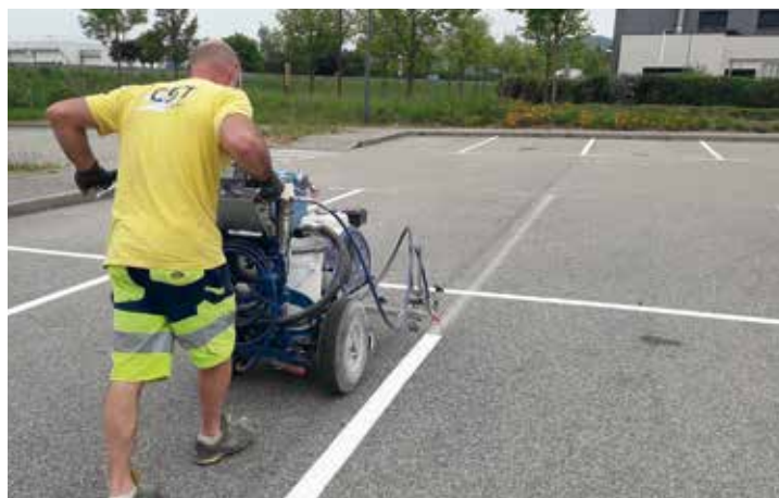
Marquage au sol sur le PA Bièvre Dauphine par la société CST

► Colas de Colombe, sur la zone d'activités de Rossatière pour un chantier test de mise en œuvre des mesures Covid-19, puis sur la voie d'accès sud à l'Espace commercial Bièvre Dauphine à Apprieu.